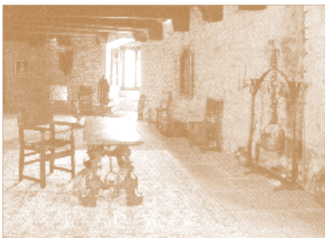
Castillo, vista general de una sala.