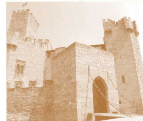
Castillo de Javier (entrada)

Hizo escala en Mozambique y algunas islas y llegó a Goa, capital de la India portuguesa el 6 de mayo de 1542. Un año de viaje. Mientras tanto, el Papa Paulo III había aprobado la Compañía de Jesús (27, sept, 1540) e Ignacio de Loyola había sido nombrado Padre General.